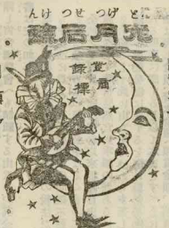
錢五十金個一價定