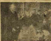
化粧品輸出懇話會のメンバー

化粧品輸出懇話會は、戦時中の化粧品工業の振興と、戦後世界の化粧品工業の発展を目的として、戦時中から活動して来た。懇話會の活動は、戦時中は戦時物資の配給と、戦後は戦後復興の促進に努めた。懇話會の活動は、戦時中は戦時物資の配給と、戦後は戦後復興の促進に努めた。懇話會の活動は、戦時中は戦時物資の配給と、戦後は戦後復興の促進に努めた。 化粧品輸出懇話會は、戦時中の化粧品工業の振興と、戦後世界の化粧品工業の発展を目的として、戦時中から活動して来た。懇話會の活動は、戦時中は戦時物資の配給と、戦後は戦後復興の促進に努めた。懇話會の活動は、戦時中は戦時物資の配給と、戦後は戦後復興の促進に努めた。