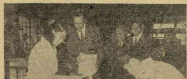
紅のわがる人に査定を 紅粧會 審議室に要求