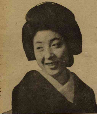
構成 石岡とみ緒